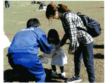
水辺プラザ秋祭りでのボランティア

学校は、子どもが社会に出て自立するための準備をするところです。将来、子どもが社会の中で自分らしく生きていくことができるように、本校では「由利中ヒューマンスキルの三本柱～返事・挨拶・清掃～」の確立を目指しています。このヒューマンスキルは、小学校においては「返事・あいさつ・あとしまつ」となっており、由利小・中学校連携による9年間のキャリア教