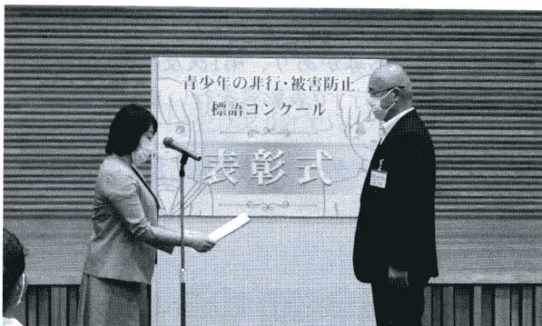
学校賞、本荘南中・森校長