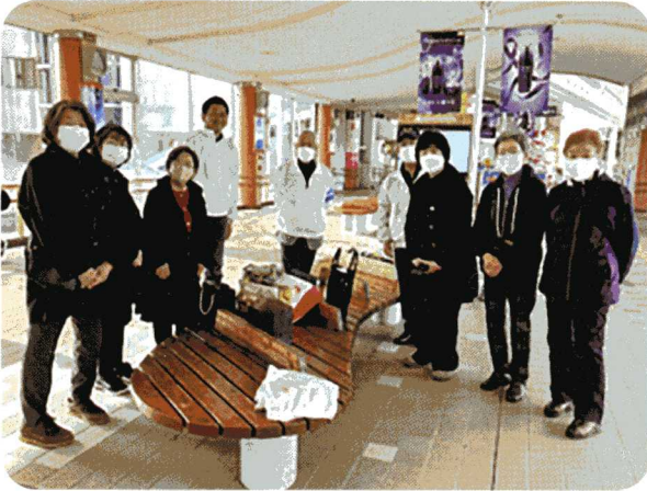
街頭啓発活動 11月23日 秋田駅ぽぽろード