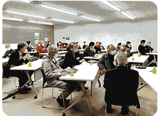
会員研修会 12月16日 秋田市センタース